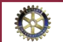
Rotary Breda kring “Mark en Aa”

Op 23 september 2002 hebben leden van Rotary “Mark en Aa” de Stichting Nederland-Krasnoyarsk opgericht. Het initiatief van de Stichting Nederland-Krasnoyarsk wordt gerealiseerd met medewerking en steun van de volgende organisaties: