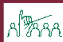
Residentiekoor (Den Haag)